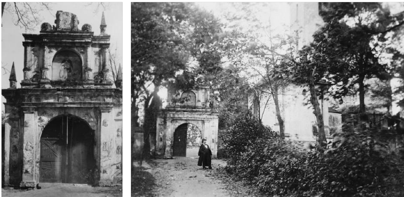
obr. 3 – Vstupní brána na počátku 20. století, před snesením barokního štítu

Před vchodem do hřbitova byl v roce 1916 umístěn pomník padlých světové války. Na podstavci z opracovaného kamene je postava muže opírajícího se o ruku. Autorem pomníku je sochař a grafik Antonín Bílek (1881-1937). Na pomníku je nápis Padlým a zemřelým hrdinům světové války. Červený kříž ve Strakonících . Každoročně se zde v době první československé republiky konala pietní vzpomínková shromáždění. V den vzniku republiky 28. října zde spolky pořádaly vzpomínkové shromáždění, na které navazoval průvod městem se zastávkami u rodného domu italského legionáře Vojtěcha Hally a rodného domu francouzského legionáře Boh. Tschinkla, kde byly osazeny pamětní desky, ke kterým zavěsili věnce. Druhé velké shromáždění u pomníku padlých, „Mírovou slavnost“, pořádal Československý červený kříž vždy v souvislosti s velikonočními svátky na Bílou sobotu (SOkA Strakonice). Pomník byl restaurován naposledy v roce 2002.