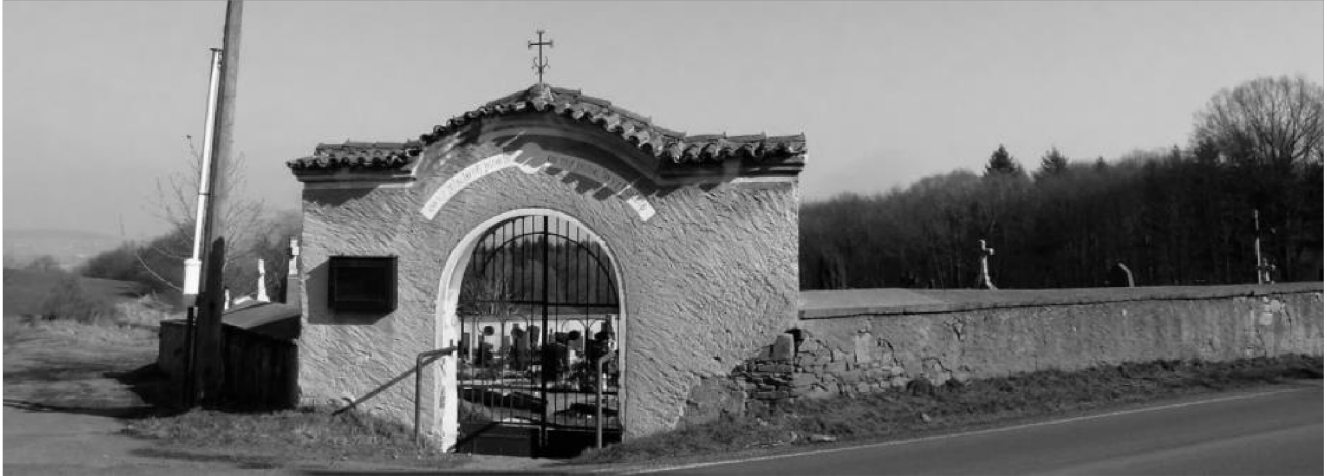
obr. 6 – Vstupní brána podsrpenského hřbitova

ke hřbitovu zákonné povinnosti, ač nebyla jeho majitelem. Stejně jako svatováclavský hřbitov byl do poloviny 20. století podsrpenský hřbitov hřbitovem církevním (konfesijním). K jeho údržbě byl zřízen vlastní hřbitovní fond. V zápisu se také odráží tehdy rozšířený strach ze zdánlivé smrti, proti čemuž se mělo čelit různými prostředky (zvonítka, zevnitř snadno otvíravé dveře). Leckde se to řešilo tím, že byl na paži mrtvého uvazován řetězem zvon, který se při sebemenším pohybu rozezní.