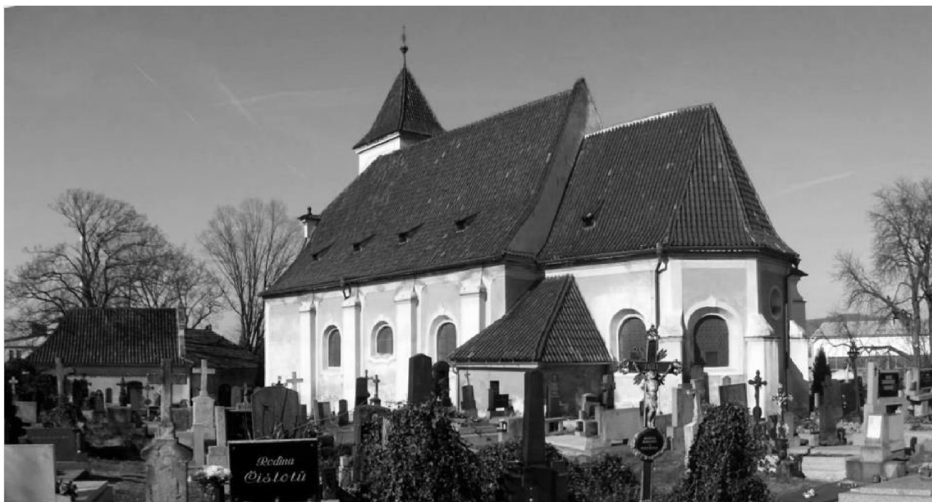
obr. 2– Kostel sv. Václava, vlevo kaple sv. Vojtěcha

Z pramenů můžeme rekonstruovat postupný plošný růst hřbitova , který dnes zaujímá značnou část půdorysu města. Hřbitov byl nejprve poměrně malý. Od konce 16. století, kdy se postupně stává hlavním strakonickým hřbitovem, docházelo k jeho opakovanému rozšiřování. Například v roce 1772, kdy postihl město hladomor, bylo tolik pohřbů, že musel být hřbitov rozšířen. Nejznámější veduta Strakonice z konce 18. století zachycuje zdí ohrazenou plochu jen v bezprostředním okolí kostela svatého Václava. Rozsah hřbitova na počátku 19. století je znázorněn v plánu stabilního katastru z roku 1837. Tehdy končil za hrobkou dědičných pošt mistrů. Okolí hřbitova silně ovlivnila stavba železnice a nádraží v letech 1867-1868. V průběhu 19. století značně vzrostl počet obyvatel ve městě a hřbitov přestával dostačovat. Dokládá to i přípis c. k. okresního hejtmana ze září 1876: (...) Tento hřbitov strakonický dle podaného úředního výkazu jenom výměru 942ll obsahuje a na něm v posledních desetiletích v průměru 248 mrtvol se pohřbívá, tedy uznávám, že hřbitov tento v tom stupni rozšířen býti musí, aby na každý hrob dvorním dekretem ze dne 23. srpna 1784 a 6. září 1787 předepsaná prostora vypadala. Potřebné kroky k tomuto rozšíření musí ve 2 měsících učiněny býti. (DÚ Strakonice, SOkA Strakonice)