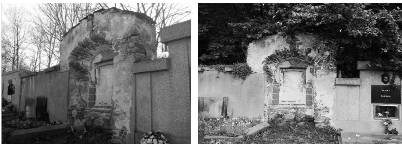
obr. 4 – Fragментy křížové cesty umístěné v rámci hřbitovní zdi

Před vchodem do hřbitova byl v roce 1916 umístěn pomník padlých světové války. Na podstavci z opracovaného kamene je postava muže opírajícího se o ruku. Autorem pomníku je sochař a grafik Antonín Bílek (1881-1937). Na pomníku je nápis Padlým a zemřelým hrdinům světové války. Červený kříž ve Strakonících . Každoročně se zde v době první československé republiky konala pietní vzpomínková shromáždění. V den vzniku republiky 28. října zde spolky pořádaly vzpomínkové shromáždění, na které navazoval průvod městem se zastávkami u rodného domu italského legionáře Vojtěcha Hally a rodného domu francouzského legionáře Boh. Tschinkla, kde byly osazeny pamětní desky, ke kterým zavěsili věnce. Druhé velké shromáždění u pomníku padlých, „Mírovou slavnost“, pořádal Československý červený kříž vždy v souvislosti s velikonočními svátky na Bílou sobotu (SOkA Strakonice). Pomník byl restaurován naposledy v roce 2002.