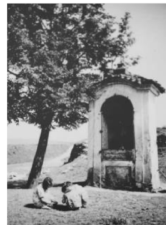
obr. 7 – kostelík sv. Martina a dvě kaple na hroby vojáků v Hradeckého ulici v období první republiky (Foto SOKA Strakonice, informační tabule u kaplí)