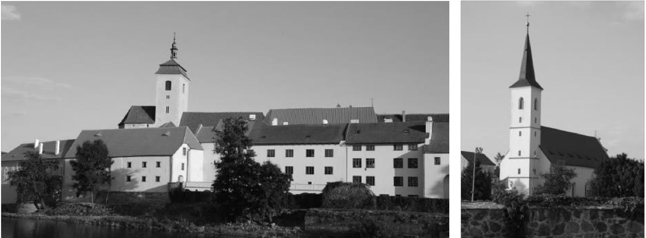
obr. 1 – Kostel sv. Prokopa (Vojtěcha) v areálu hradu a kostel sv. Markéty

ukazuje již na 12. století. Později byl zřízen hřbitov poblíž johanitské komendy, nejstarší církevní části hradu. Tento hřbitov se však už v průběhu středověku přestal používat. Do dnešní doby byla při různých příležitostných archeologických výzkumech v okolí objevena řada hrobů.