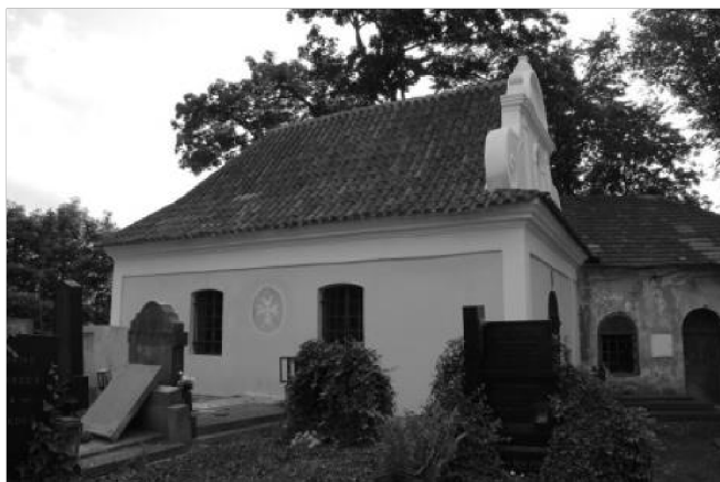
obr. 5 – Kaple Nejsvětější Trojice a kaple sv. Vojtěcha