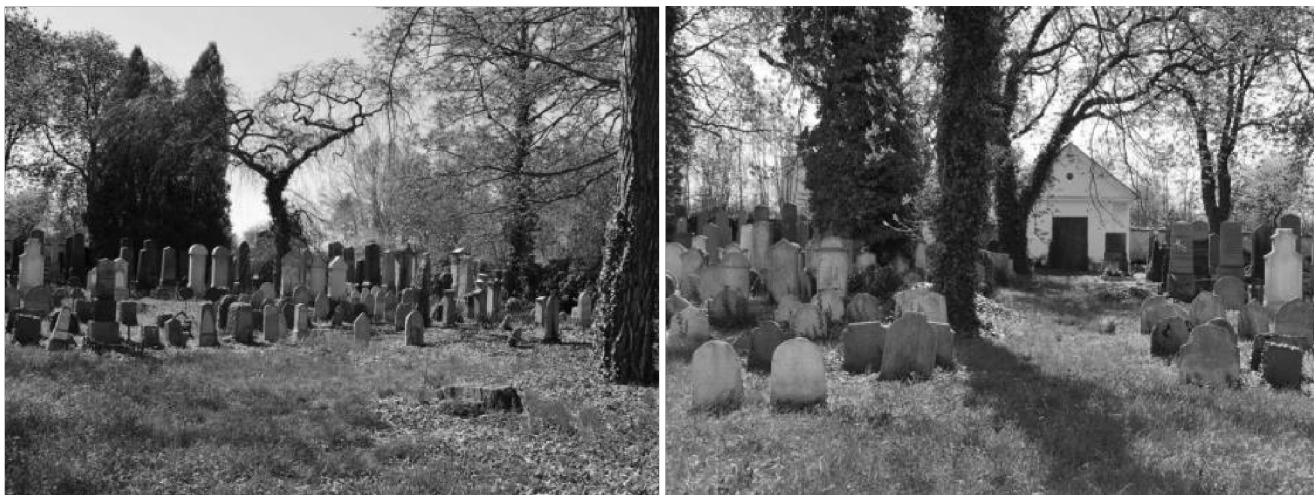
obr. 8 – Židovský hřbitov ve Strakonících

Hřbitov je obehnan vysokou kamennou zdí, jež měla zaručit ochranu hrobů před znesvěcením. V čele hřbitova je malý domek, který plnil funkci márnice. Jedná se o jednoduchou symetrickou stavbu s trojúhelníkovým štítem a valbou. Stavba je klenutá. Do bočních stran jsou prolomena okna s půlkruhovým obloukem. Štít hlavní fasády zdobený římsami je nesen dvěma pilastry s kompozitními hlavicemi. Byla postavena v 19. století, kdy byla také měněna rozloha hřbitova. Ještě na plánech stabilního katastru (1837) má hřbitov jiný tvar a je bez márnice. V rohu hřbitova je zřízena pumpa k symbolickému omytí rukou po skončení pohřebního obřadu.