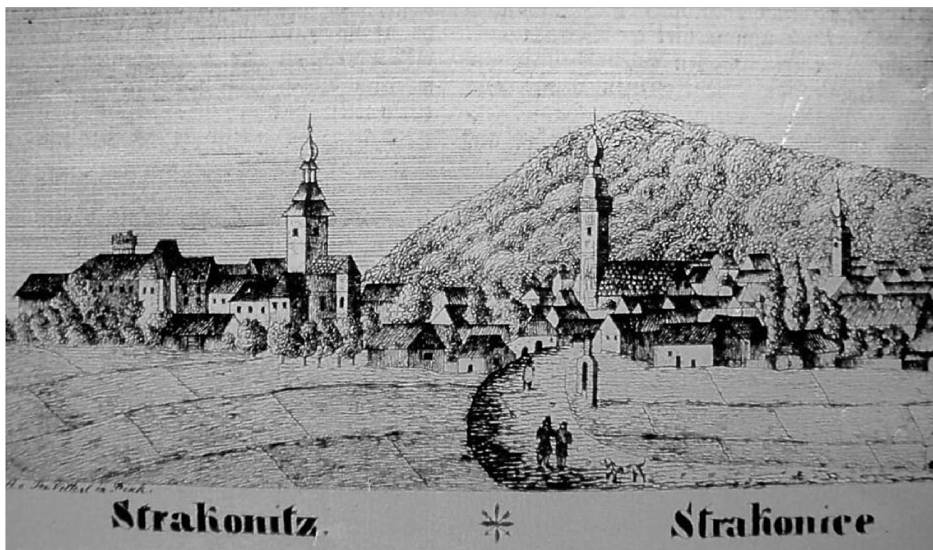
obr. 10 – Veduta Strakonice z 19. století s věžemi kostelů sv. Prokopa a sv. Markéty

Nařízení vlády č. 219/1949 Sb., o hospodářském zabezpečení církve římsko-katolické státem