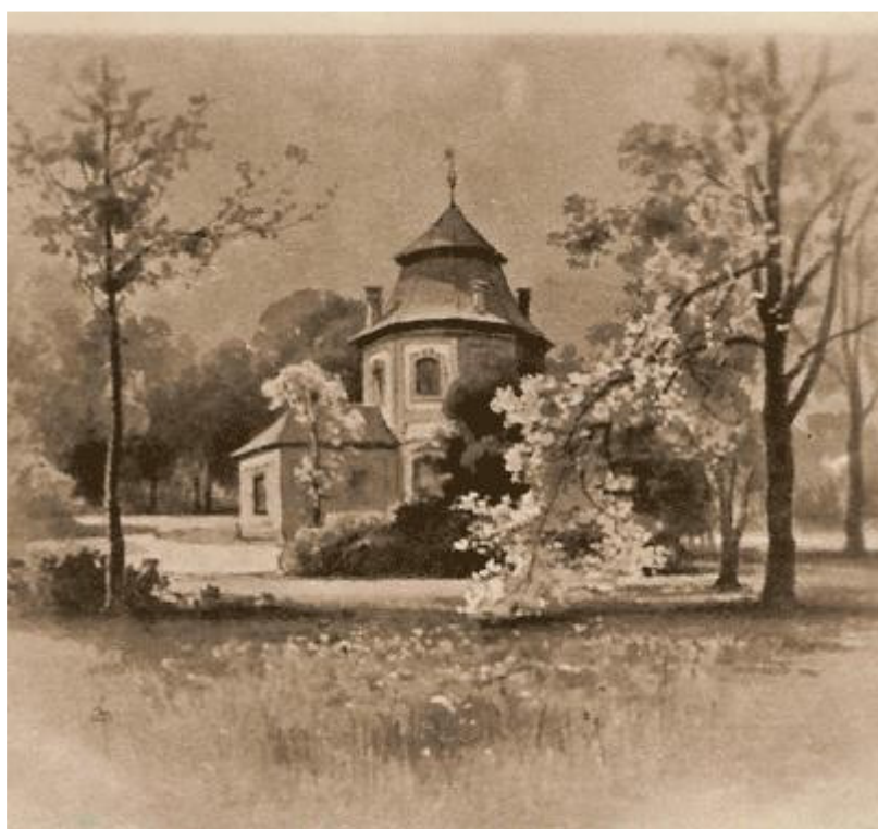
Obr. 5 Neulust, postavený v roce 1790 na obrazu Adolfa Liebschera. http://www.uhersko.cz/image.php?nid=955&oid=1136036&width=404&height=378