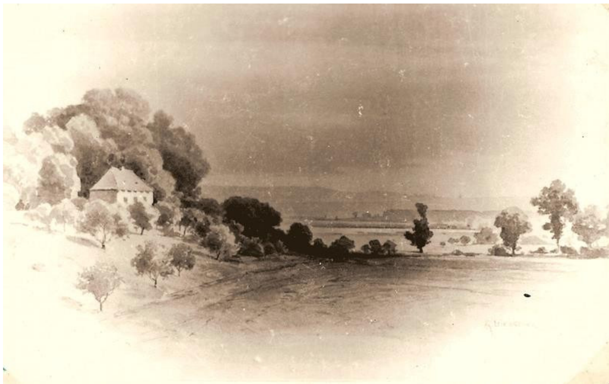
Obr. 6 Zděný domek u zámečku Neulust http://www.uhersko.cz/image.php?nid=955&oid=1136037&width=800&height=501