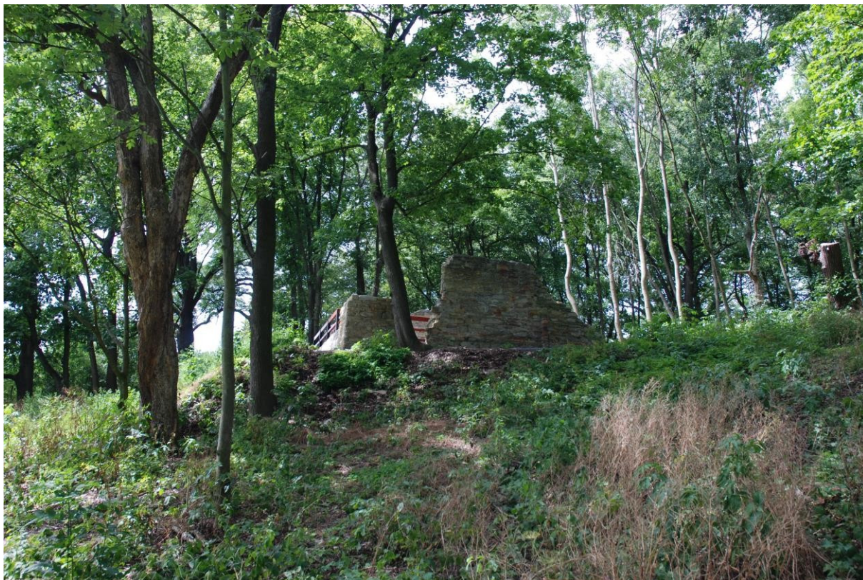
Obr. 8 Současná podoba Teresienlustu.