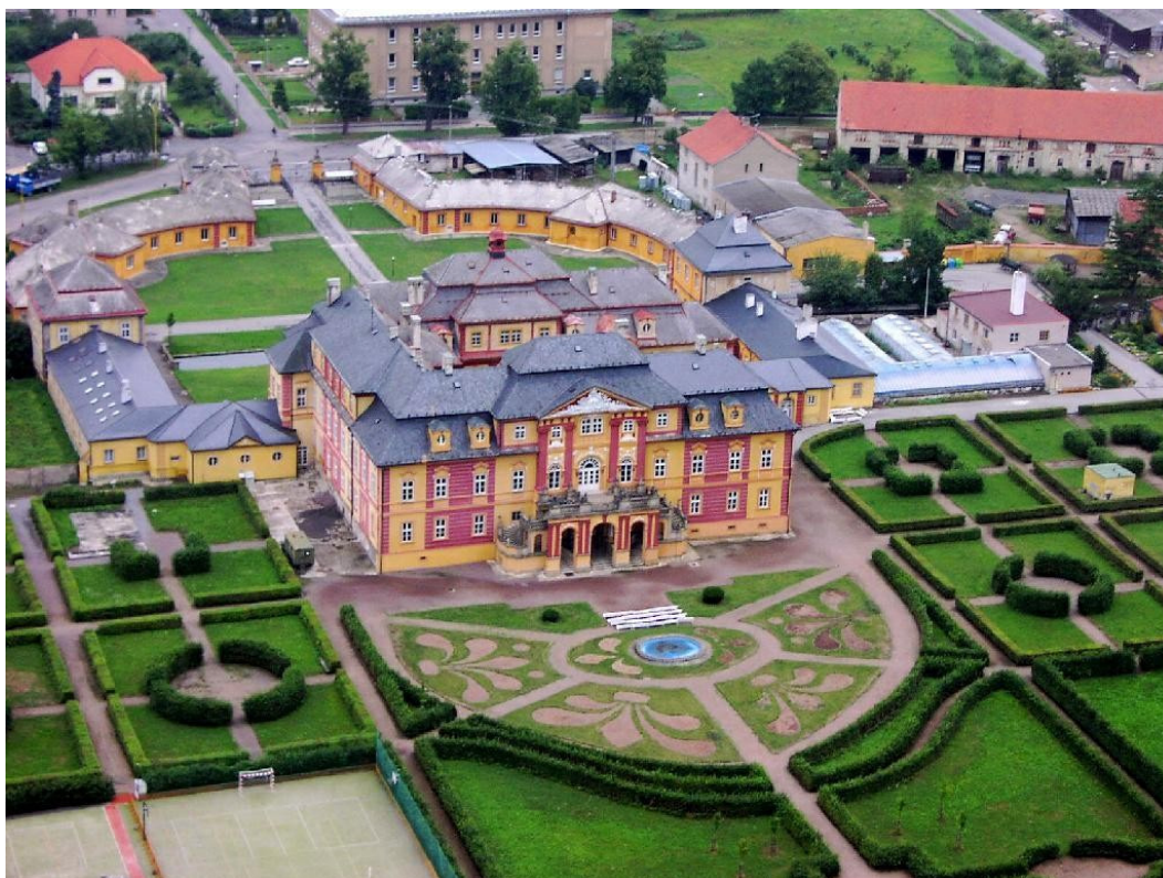
Obr. 4 Letecký pohled na zámek Chroustovice a zámeckou zahradu.