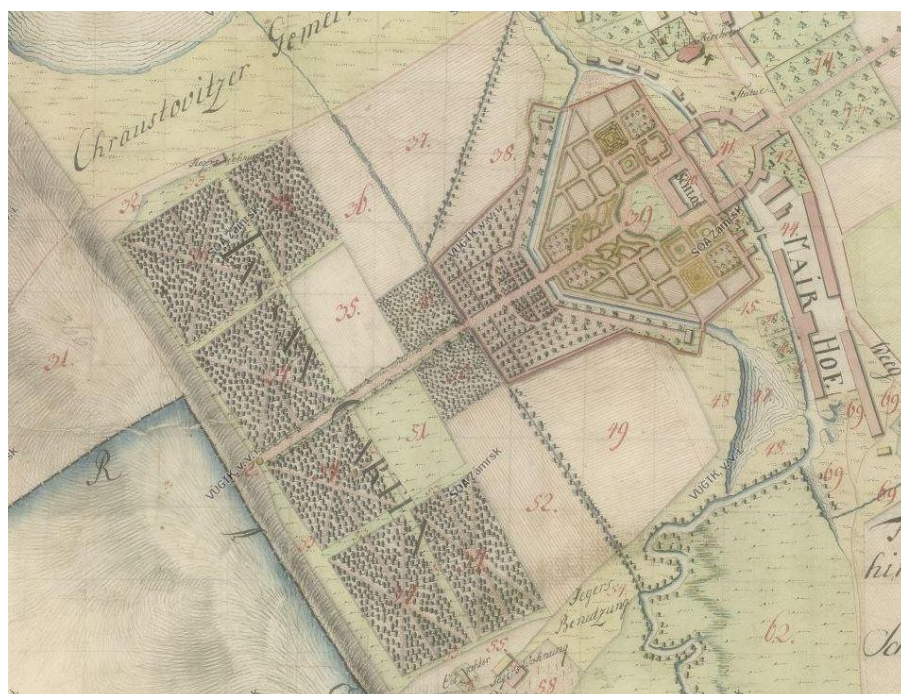
Obr. 2 Zámecká zahrada s bažantnicí v Chroustovicích (Mapa vrchnostenských dvorů v Chroustovicích, Státní oblastní archiv v Zámrsku, 1780). Na osu zámecké zahrady navazuje v západojižním směru prostor zámecké bažantnice. Bažantnice je členěna do osmi obdélníků. Šest z nich bylo zalesněno a rozděleno do šestiramenné hvězdice průseků. Zbylé dva centrální čtverce byly lučního charakteru oddělené od sebe alejí.