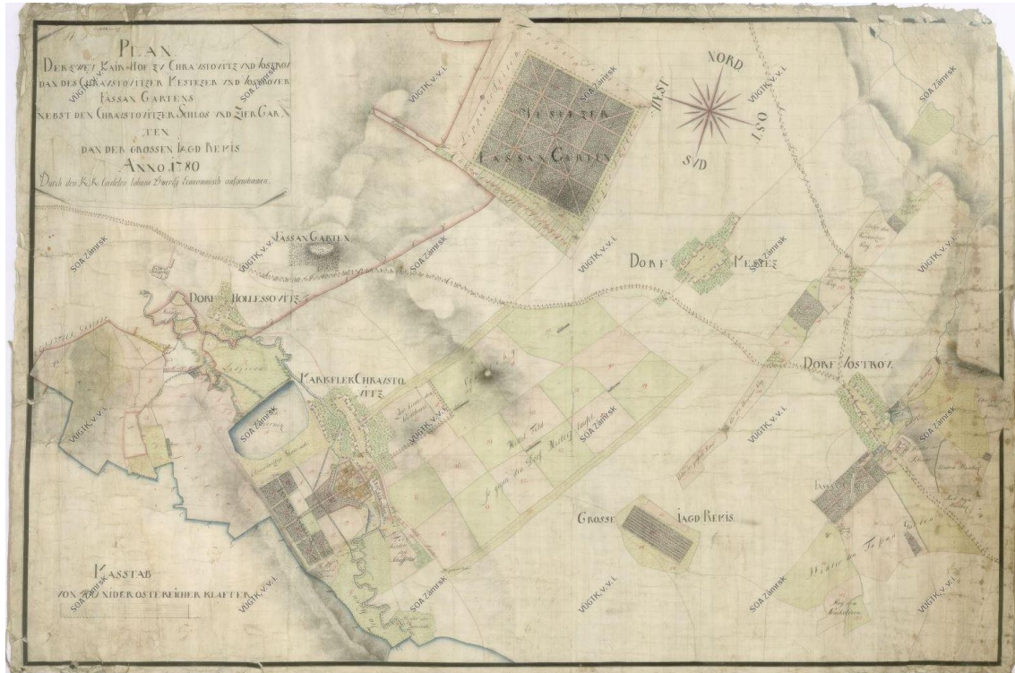
Obr. 3 Mapa vrchnostenských dvorů v Chroustovicích s čitelnou centrální kompozicí a s vazbou na lovecký remíz, Státní oblastní archiv v Zámrsku, 1780.

Významný vliv na krajinu mají také mlýnské náhony, kanál a průplavy – například Dvakačovský náhon – vybudovaný za Viléma z Pernštejna a převádějící vodu Novohradky přes Loučnou až do Labe u Pardubic. (PACÁKOVÁ-HOŠŤÁLKOVÁ 1999)